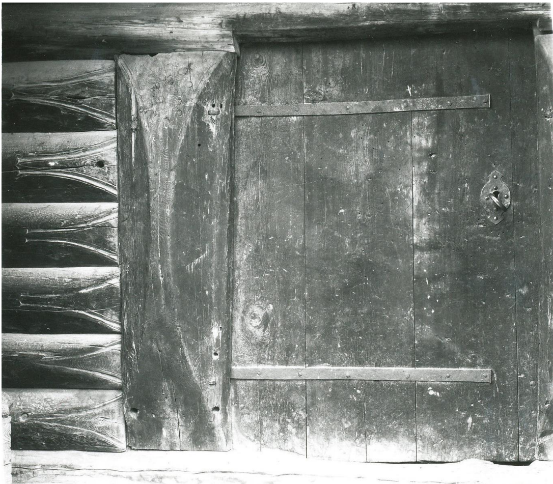
Dør på mellomalderloftet på nordgard Sandbu