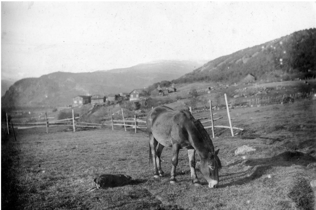
Nordgard og oppigard Nord-Sandbu

Jakup Skjedsvoll: internplassing av opplysningar for Sandbu-gardar 1666-ca.1800