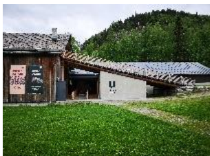
Figur 1 Galleri Ullinsvin